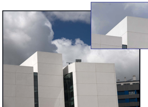
La fuerza gráfica de la selección es mucho mayor que la foto en su totalidad.