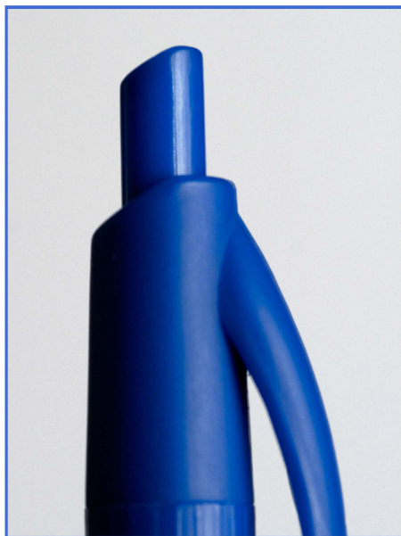
Muchos de los objetos más comunes se prestan a nuestro juego del menos es más .