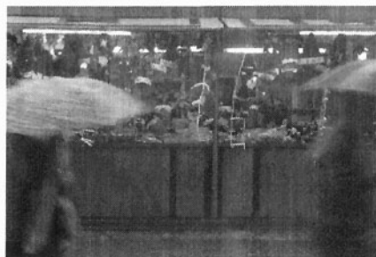
(original en color)