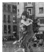
(original en color)