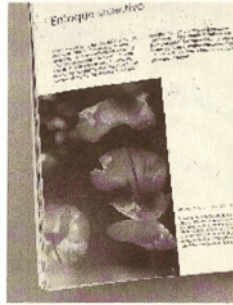
Fotografía con dos lados a sangre

El término sangría se aplica al espacio en blanco colocado delante de una o varias líneas de texto, generalmente la primera línea de cada párrafo, como se ve al principio de este párrafo.