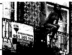
(original en color)