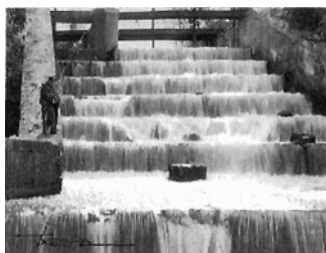
(original en color)